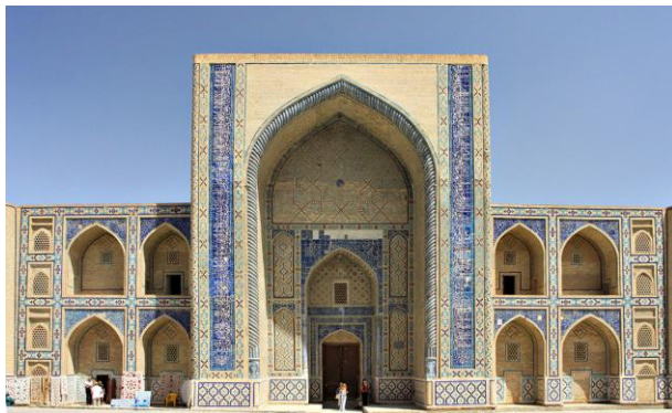
4-расм. Улуғбек мадрасаси. Бухоро. (1417-йил)

XIV-XVII асрларда Самарқанд ва Бухоро шаҳарлари меъморчилик ёдгорликларидаги равоқлар ўзининг конструкцияси билан бошқаларидан фаркланади. Бу давр меъморчилик биноларида уч, тўрт, беш марказли найзали равоқлар кўп қўлланилган. Мирзо Улуғбек қурдирган Бухоро ва Самарқандаги Улуғбек мадрасалари (1417 йил) равоқлари уч марказли найзали равоқ бўлиб, биноларда равоқнинг квадратидан баландроқ кўтарилиш шакли қўлланилган. Равоқ ясашиш марказларини сони асосий аҳамиятга эга эмас, аммо эгриликнинг ясашиш аҳамияти катта бўлиб, улар паст, ўрта, баланд, ҳолатдаги кўринишдан цилиндрик, шаргумбаз шаклларда ясалган.