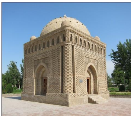
1-расм. Исмоил Сомоний мақбараси. Бухоро IX- аср охири X-аср бошлари

Икки марказ орқали ясаладиган равоқни Бухорода IX- аср охири ва X-аср бошларида барпо этилган Исмоил Сомоний мақбарасининг ташқи кўринишида кўришимиз мумкин.