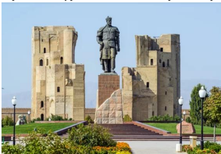
3-расм. Шаҳрисабз. Оқсарой мажмуаси.

Равоқнинг ички катта юзаси бурчак минорали ғиштин кошиндан терилган, қоплама эса геометрик шакл кўринишдаги кошинлардан иборат.