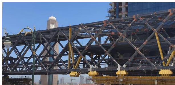
1-rasm. Dubayda dunyodagi eng uzun konsol

Jamiyatimiz taraqqiy qilishi natijasida erga bo'lgan extiyoj axolining oshishi va turarajoylarga bo'lgan talabning oshishi natijasida shaxarni yuqoriga tomon o'stirish g'oyalari bugungi kunning dolzarb masalasiga aylanmoqda. SHunday ekan loyihalananayotgan ko'p qavatli turarajoy binolarini kelgusda yangicha innavatsion yondashuvlar asosida shaharsozlik me'yoriy qoidalariga yangicha yondashgan xolda loyihalash davr talabi sifatida amalga oshirishi zarurligini taqoza etmoqda.