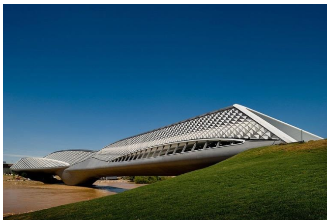
4-rasm. Zaha Hadid pavilion ko'prigi, Saragosa, Ispaniya

Hera shoxlaridan biri bo'ylab tosh ko'prik 1325 yilda qurilgan va "qirollik" savdo yo'lining bir qismi edi. Dastlab, bino yog'och edi va doimo yong'inlardan aziyat chekardi. Ayni paytda bu yerda 32 ta yarim yog'ochli uylar va turli do'konlar joylashgan.