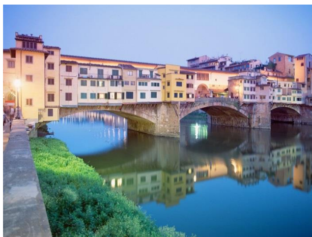
2-rasm. Ponte Vecchio ko'prigi, Florensiya, Italiya

Xorijiy tajriba shuni ko'rsatadiki ko'prik shaklidagi uylar loyihalari mustaxkam tanchlarga o'rnatilganligi va ushbu tayanchlar faqat ko'tarish vositasida xizmat qiladi. 2-rasm.