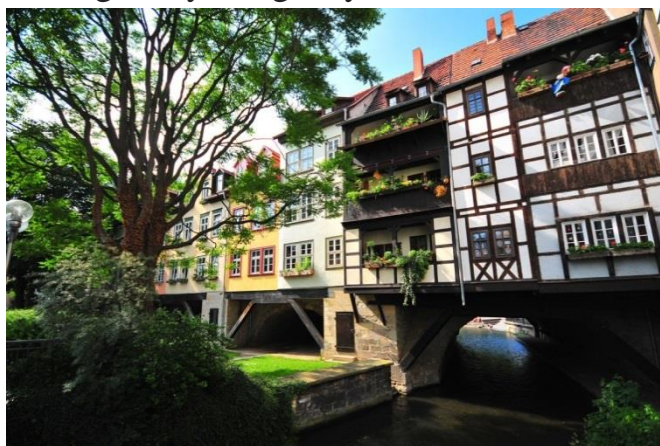
3-rasm. Kremerbryucke ko'prigi, Erfurt, Germaniya

Taxminlarga ko'ra, "bankrotlik" atamasi bu erda paydo bo'lgan, bu dastlab soqchilar tomonidan buzilgan bankrot savdogarning hisoblagichini anglatadi. Ko'prikning yuqori qismi – Vasari yo'lagi shaxsan Dyuk Kosimo I uchun qurilgan bo'lib, u savdo arkadasini chetlab o'tib, bir qirg'oqdan boshqasiga o'tishi mumkin edi. Endi bu xonani san'at galereyasi egallaydi.