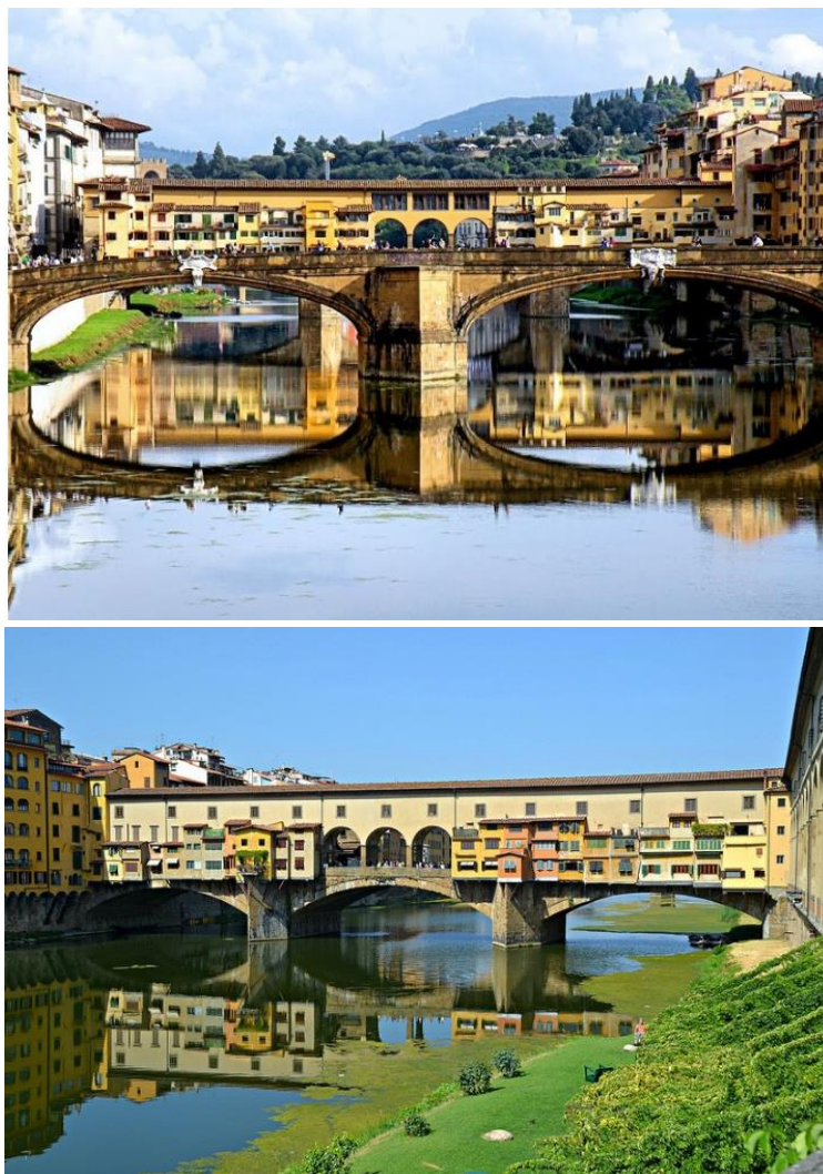
5-rasm. Florensiyadagi Ponte Vecchio oltin ko'prigi

1938 yilda Mussolini hukmronligi davrida Ponte Vekkioni Adolf Gitler ziyorat qildi, ayniqsa uning kelishi uchun Vasari koridorining markaziy qismida bugungi kungacha saqlanib qolgan katta panoramali derazalari bo'lgan kuzatuv maydonchasi yaratilgan. Natsist qo'shinlari chekinganidan so'ng, bu Florensiyada 1944 yildagi jangovar harakatlar paytida nemislar vayron qilmagan yagona ko'prik edi.