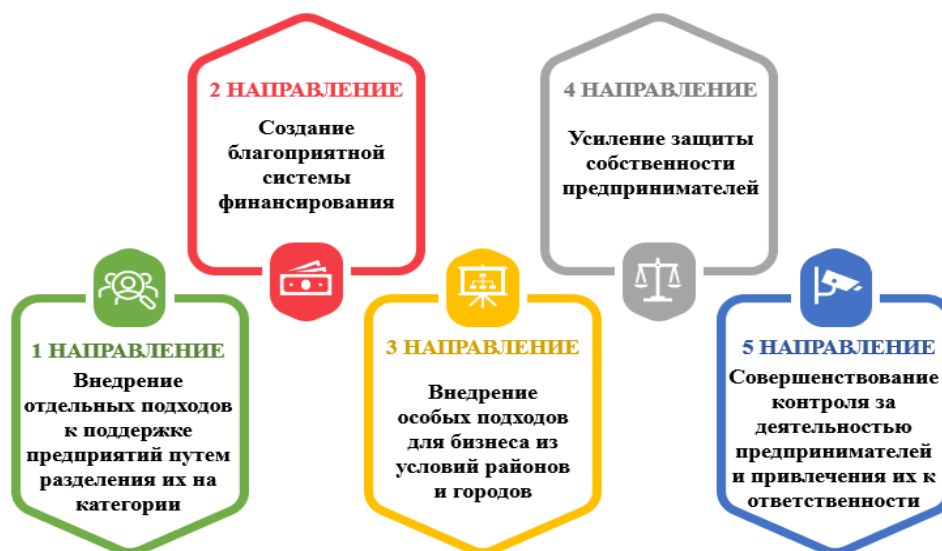
Рис. 3. Пять основных направлений по поддержке малого и среднего бизнеса в 2022-2023 гг.

1 направление - внедрение отдельных подходов к поддержке предприятий путем разделения их на категории. В первом направлении определено внедрение отдельных подходов к поддержке предприятий путем разделения их на категории.