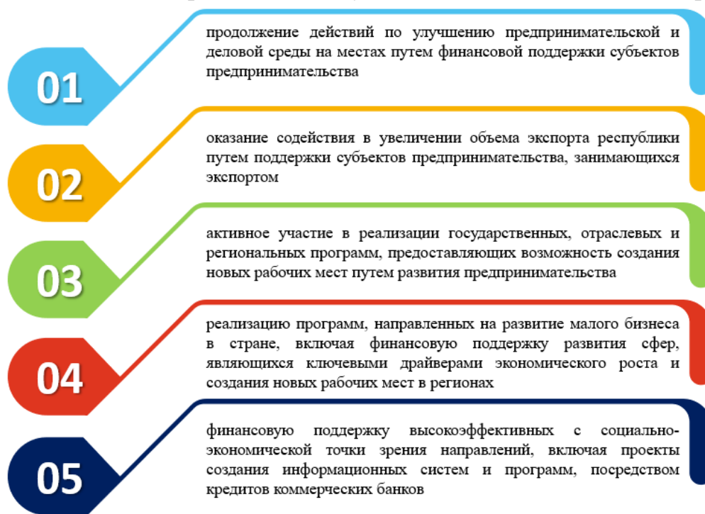
Рис. 2. Основные направления деятельности Государственного фонда поддержки предпринимательской деятельности в направлении поддержки субъектов малого предпринимательства

реформ по развитию предпринимательства основными направлениями деятельности Государственного фонда поддержки предпринимательской деятельности в направлении поддержки субъектов малого предпринимательства определены следующие, как показано ниже на рис. 2.