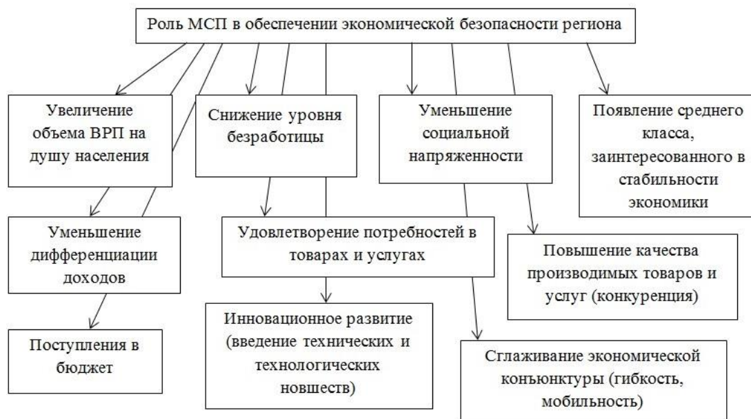
Рис. 1. Роль малого и среднего предпринимательства в обеспечении экономической безопасности региона

Государственная политика в области финансовой поддержки развития малого и среднего предпринимательства занимает отдельное место в управлении экономикой страны.