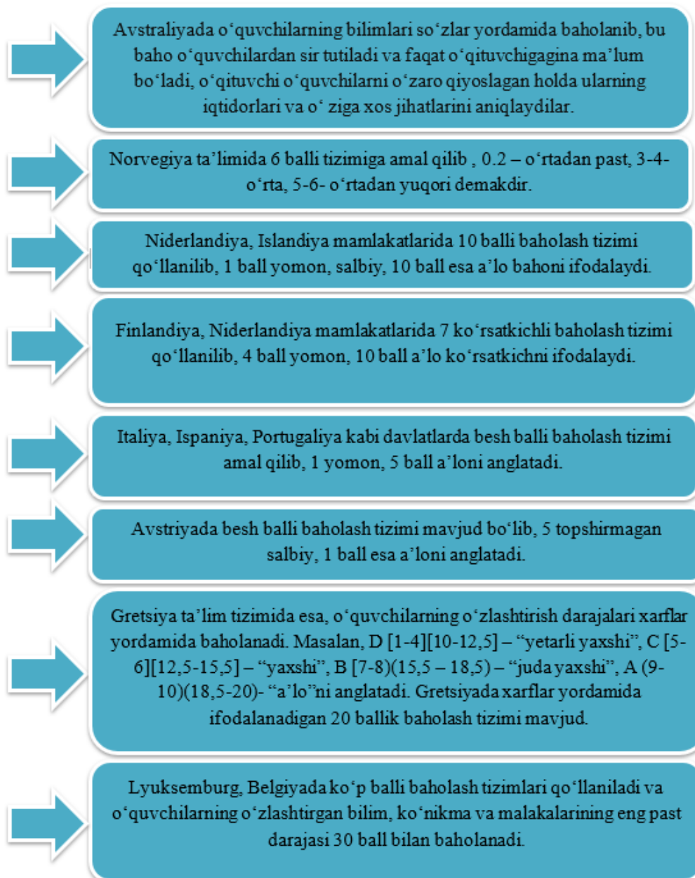
1.2-rasm. Rivojlangan mamlakatlarning o‘quvchilarni baholash tizimi.

Xususan rivojlangan mamlakatlarda o‘ziga xos baholash tizimi mavjud bo‘lib, quyidagilarda ko‘rishimiz mumkin: