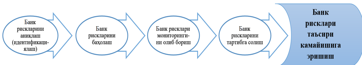
2-расм. Банк рискларини бошқариш босқичлари 4

Банк рискларини мониторинг қилиш ва уларни самарали бошқариш борасида ривожланган ва ривожланаётган давлатлар (Буюк Британия, Канада, Япония, Германия, Россия Федерацияси) тажрибасидан келиб чиқиб, банк рисклари натижасида келиб чиқувчи бозор таваккалчилигини бошқариш қуйидаги босқичлардан иборат бўлиши таклиф этилди (2-расм).