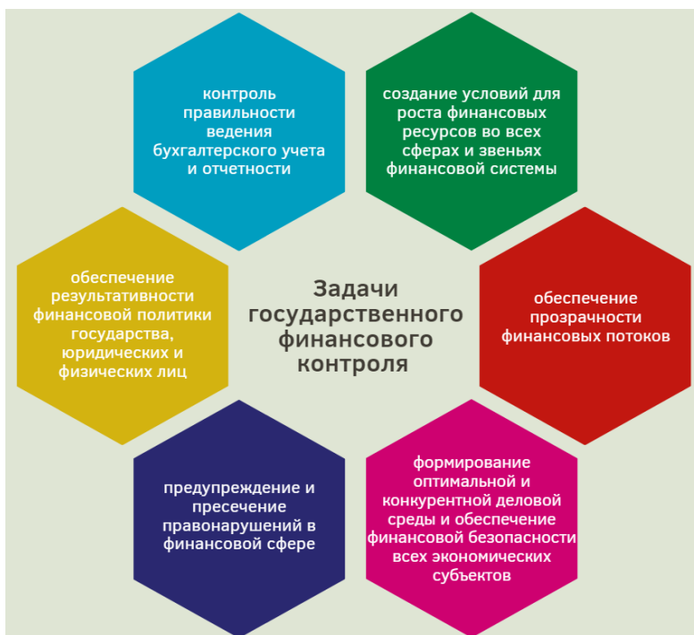
Рис. 3. Основные задачи государственного финансового контроля 6

Цель и задачи финансового контроля определяются по отношению к разным объектам финансового контроля 7 .