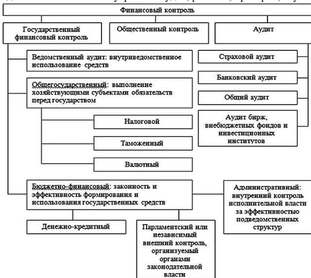
Рис.2. Система финансового контроля и её основные звенья 5

Виды ГФК: внешний и внутренний аудит, ревизии, проверки, изучения.