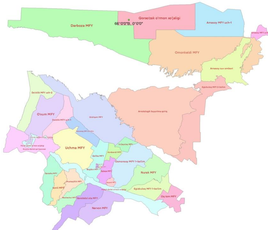
Jizzax viloyati, Forish tumanining xaritasi

Hozirgi kunda kichik biznesni va xususiy tadbirkorlikni sub'yektlari bozor kon'yunkturasi o'zgarishlariga ham, iste'molchi talabi o'zgarishlariga ham tez moslashishga qodir bo'lib, iste'mol bozoridagi muvozanatni ushlab turishda muhim rol o'ynab kelmoqda, bu esa raqobat muhitining shakllanishiga bu esa kichik biznesni va xususiy tadbirkorlik xizmatlarini rivojlantirishda asosiy omillardan biridir. Yuqorida aytilgan va keltirilgan fikrlarimizni Forish tumanining tuzulish va olib borilayotgan isloxoatlarni ko'rib chiqamiz. Forsh tumanida joriy yilning yanvar-iyun oylarida tumanda 308,1 mlrd. so'mlik sanoat mahsuloti ishlab chiqarilishi amalga oshirilgan bo'lib, shundan 291,4 mlrd. so'm kichik biznes sub'yektlari tomonidan ishlab chiqarilgan sanoat mahsuloti tashkil qilgan bu esa yoshlarni bandlik xolatlarini taminlaganligini ko'rishimiz va bu orqali saanoat subyektlaridagi o'sishni kuzatamiz.