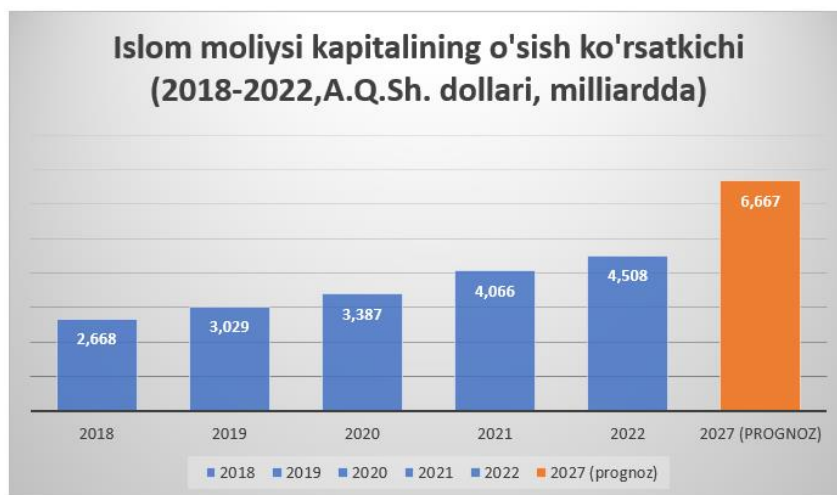
1-rasm. Islom moliysi kapitalining o'sish ko'rsatkichi. 2

Yuqoridagi diagrammadan shuni ko'rsak bo'ladiki, islom moliyasining umumiy kapitali yildan-yilga tobora o'sib bormoqda. Xatto, 2020-yil pandemiy davri bo'lsa ham 11% ga oshgan. Bundan tashqari, so'nggi yillarda, 2021 va 2022 yillarda ko'rsatkichlar umiy kapitalning oshishi yarim milliardga tengligini ko'rsatmoqda. Bu esa, albatta kata ko'rsatkich hisoblanadi. agar, fors-major holatlari bo'lmasa, va barqarorlik shu tarzda davom etsa, 2027-yilga kelib islom moliyasi kapitalining umumiy miqdori 6 milliard 667 million A.Q.Sh. dollariga teng bo'lishi mumkinligi prognoz qiligan.