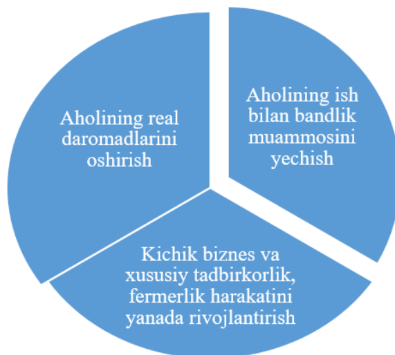
1-rasm. Mustaqillik yillarida aholi turmush farovonligini oshirishning asosiy yo'nalishlari [4]

O'zbekistonda keyingi yillarda jamiyatimiz hayotidagi yangilanish jarayonlari va islohotlarni chuqurlashtirishning mantiqiy davomi bo'lib iqtisodiyotning salohiyati, barqarorligi va mutanosibligini mustahkamlash asosida ijtimoiy himoyani kuchaytirishga va fuqarolarning turmush darajasini yaxshilashga qaratilgan ishlarimizda yangi va yuksak bosqich bo'ldi. Bu davrda aholining ijtimoiy himoyasi tizimini mustahkamlash, uning manzilliligini oshirish, ijtimoiy himoyaning faol shakllarini yo'lga qo'yish alohida dolzarblik kasb etdi.