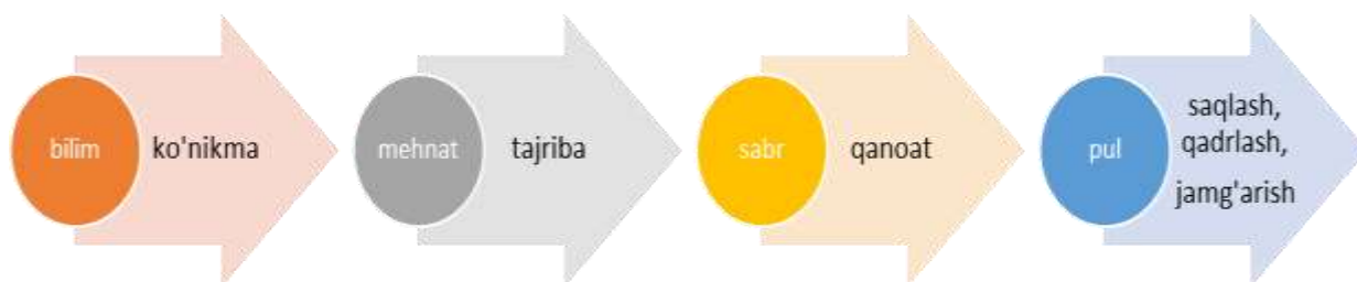
1-rasm. Moliyaviy savodxonlikni shakllantirish usullari 2 .

Jahonning ko'plab mamlakatlarida moliyaviy savodxonlikni mustaqil fan sifatida yoki ta'lim muassasalarida o'qitiladigan mavjud fanlar doirasida joriy etish bo'yicha