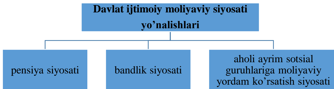
6-rasm. Davlat ijtimoiy-moliyaviy siyosati yo'nalishlari [2]

Hozirgi paytda davlatning ijtimoiy moliyaviy siyosati umumiy tarzda pensiya siyosati, bandlik siyosati, aholi ayrim sotsial guruhlariga moliyaviy yordam ko'rsatish siyosati va boshqa siyosatlarni o'z ichiga oladi (2-rasm).