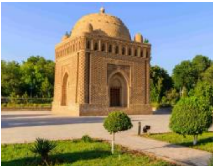
1-rasm. Ismoil Somoniy maqbarasining umumiy ko'rinishi.