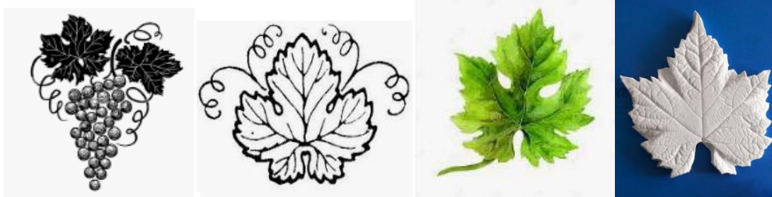
3-rasm. Uzum mevasi va bargini tasvirlash

Bu naqshni o'rganishda talabalar dastlab amaliy tasviriy faoliyat jarayonida uzum mevasi va bargi ko'rinishlarini tasvirlashni nazriy va amaliy jihatdan o'rganadilar. (3-rasm). Shundan so'ng tanlangan shakl va naqsh elementlarini naqsh kompozitsiyasi tarkibiga qo'shish uchun bezak shakliga chizib keltiradilar. Bunda talabalar bir butun yaxlit islimiy naqshning tashqi ko'rinishlarini bir nechata badiiy chiziqlar yordamida aniq va o'ziga o'xshash qilib tasvirleydilar.