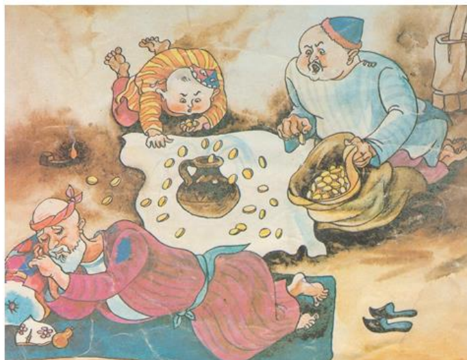
1-rasm. "Ur, to'qmoq" ertagiga ishlangan illustratsiya

Bunda jarayonda namoyish etilayotgan illyustratsiyalarni g'oya, mazmun, kompozitsiya, rang jihatdan ham to'la tahlil qilish kerak bo'ladi. (1-rasm).