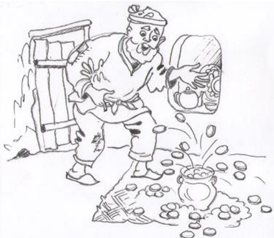
2-rasm. „Qayna, xumcha“ syujeti uchun ishlangan illustratsiya qalamtasviri

Syujet rangtasvirning ifodaviy vositalari, kopmozitsiyasi, rang orqali amalga oshiriladi. (3-rasm). Ertak illyustratsiyasining syujeti qog'oz format yuzasida rangli qalamlar yoki akvarel bo'yoqlari yordamida bajariladi. Ertak syujetlari asosida illyustratsiya ishlashda voqeylikni badiiy tasvirlash va talqin qilish rangtasvir bajarish jarayonida namoyon bo'ladi. U muhim ijtimoiy mazmun va rangbarang g'oyaviy vazifalardan bajarishni talab etadi. Rang berishda birinchi navbatda suyultirilgan yorqin ranglar bilan boshlab, ko'p qatlamli yoki rangni bir quyishda bir qatlamni dekorativ tusli bajarish ham mumkin.